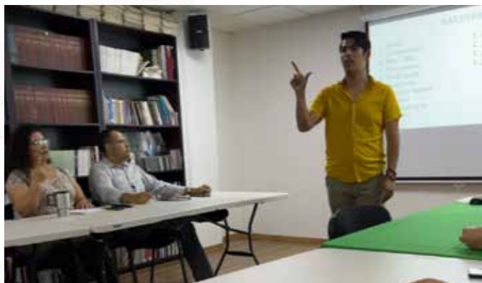
Taller "Lengua de Señas Mexicana"